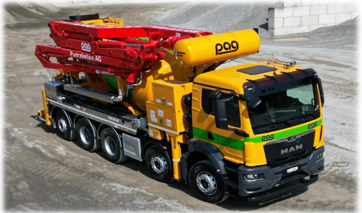
Arbeitsbereich FBP 26 4